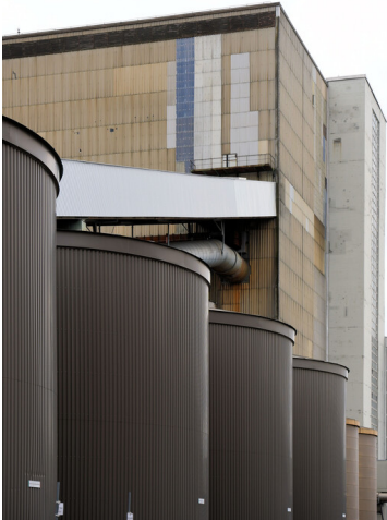
Kraftwerk Niederaußem: Kesselhaus Block A, Ansicht von Nordwesten