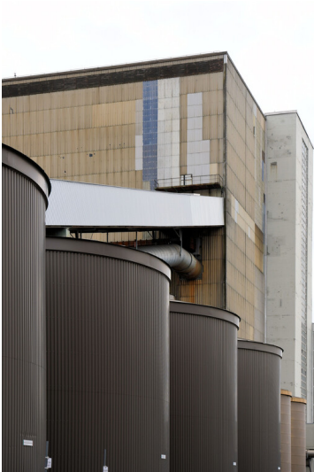
Kraftwerk Niederaußem: Kesselhaus Block A, Ansicht von Nordwesten; Foto: 15.08.2023