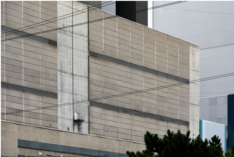
Kraftwerk Niederaußem: Schwerbau Block H, Ansicht von Süden