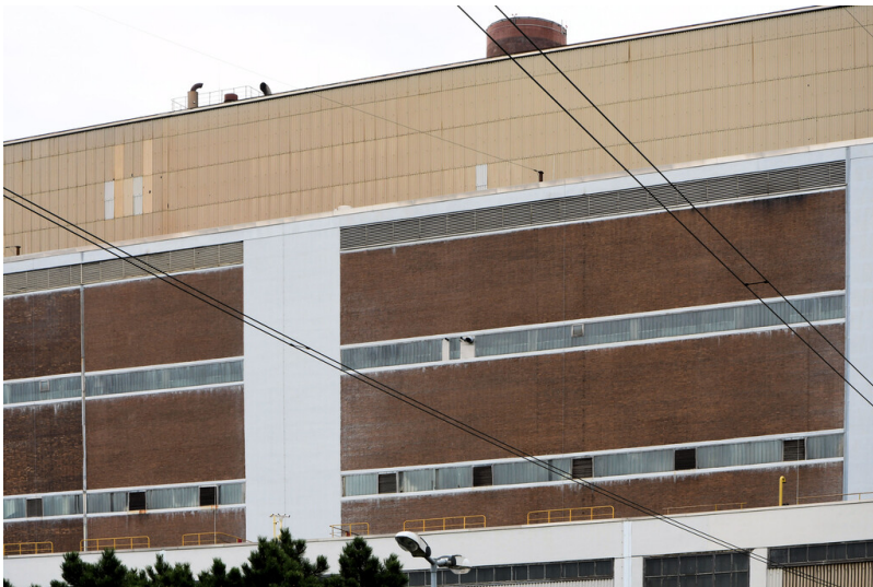
Kraftwerk Niederaußem: Schwerbau Block E, Ansicht von Südosten; Foto: 15.08.2023