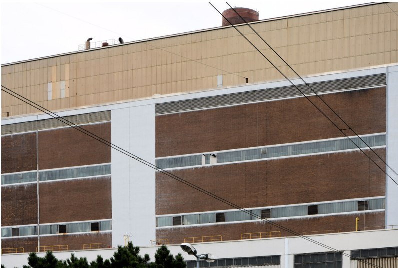
Kraftwerk Niederaußem: Schwerbau Block E, Ansicht von Südosten; Foto: 15.08.2023