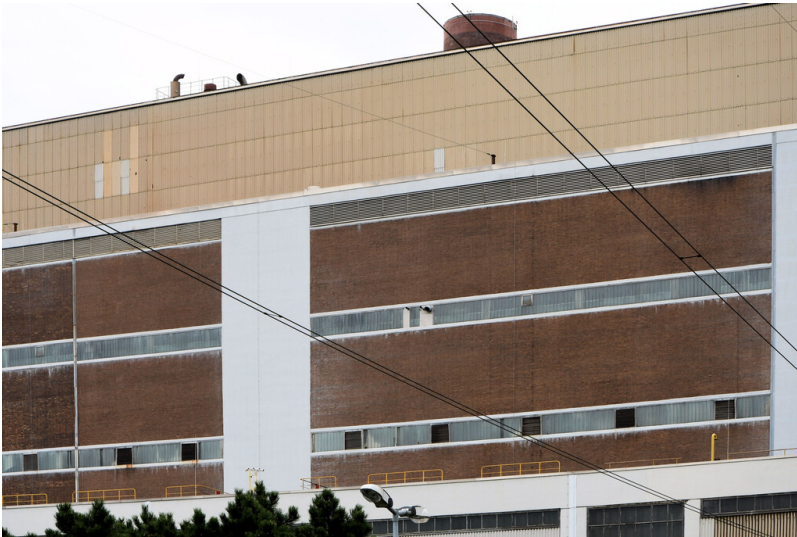
Kraftwerk Niederaußem: Schwerbau Block E, Ansicht von Südosten; Foto: 15.08.2023