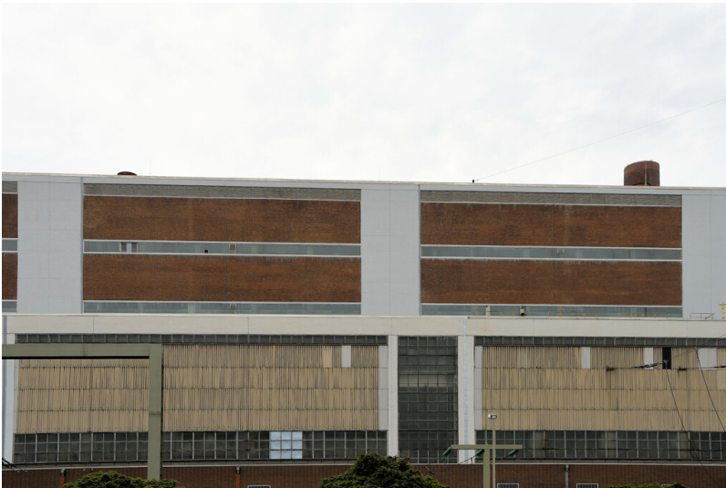
Kraftwerk Niederaußem: Schwerbau Block C1/C2, Ansicht von Südosten; Foto: 15.08.2023