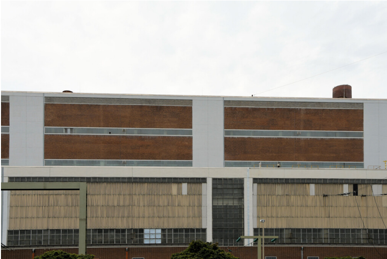
Kraftwerk Niederaußem: Schwerbau Block C1/C2, Ansicht von Südosten; Foto: 15.08.2023