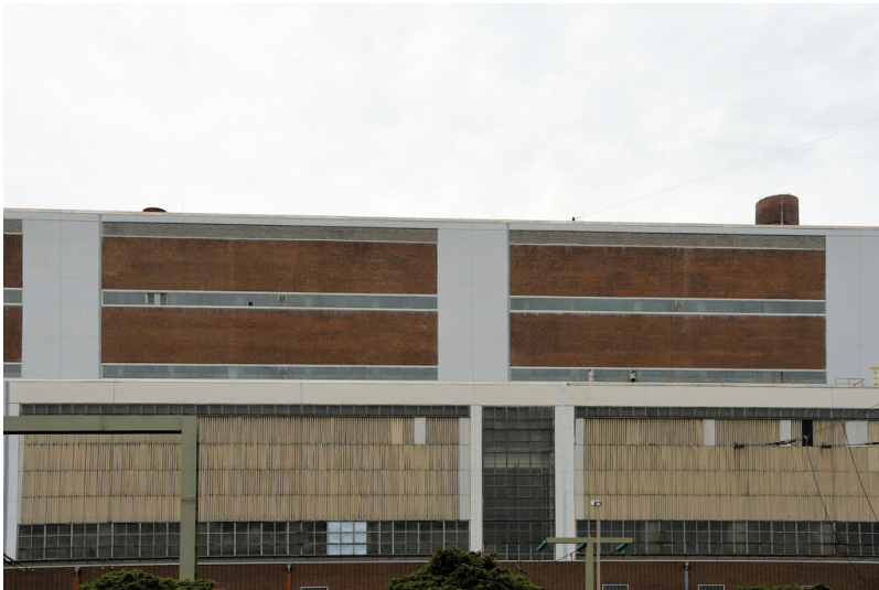
Kraftwerk Niederaußem: Schwerbau Block C1/C2, Ansicht von Südosten