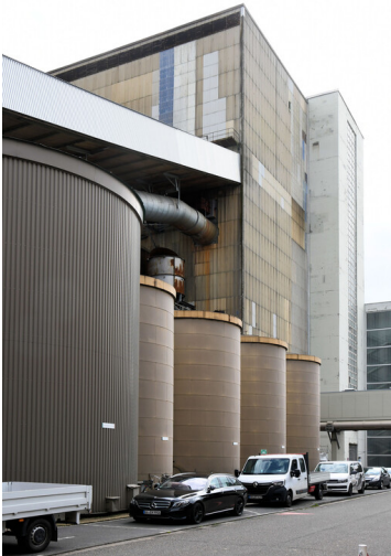
Kraftwerk Niederaußem: Bekohlungsweg Schwerbau Block A, Ansicht von Nordwesten