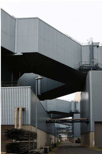
Kraftwerk Neurath (Neuanlage): Saugzugweg, Ansicht von Osten; Foto: 23.10.2023