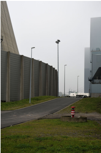
Kraftwerk Neurath (Neuanlage): Block-G-Straße, in Höhe Abzweig von der Nordstraße, Ansicht von Norden