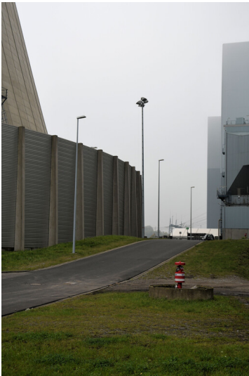
Kraftwerk Neurath (Neuanlage): Block-G-Straße, in Höhe Abzweig von der Nordstraße, Ansicht von Norden