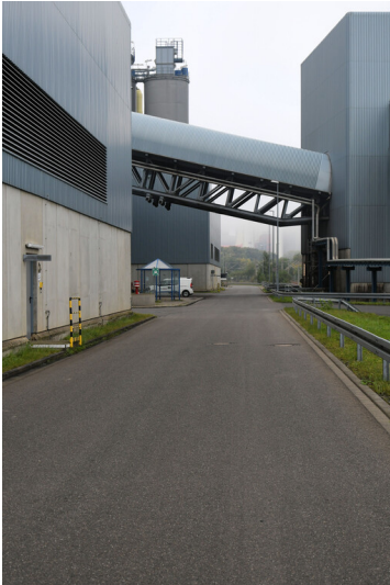
Kraftwerk Neurath (Neuanlage): Nordstraße, in Höhe Absorber-/Pumpenhaus G, Ansicht von Osten; Foto: 23.10.2023