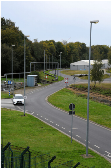
Kraftwerk Neurath: Kiesgrubenstraße, von der Altanlage kommend kurz vor Erreichen der Neuanlage, Ansicht von Nordosten; Foto: 23.10.2023