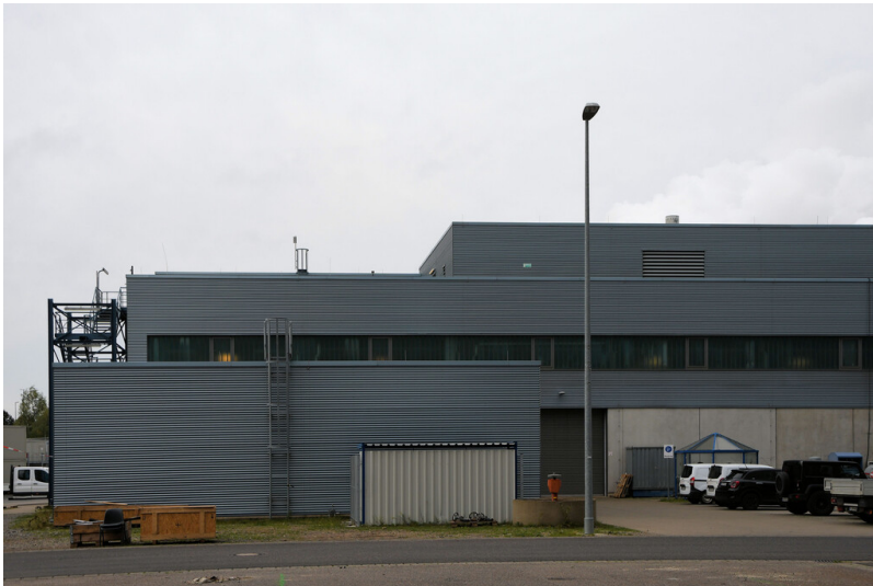
Kraftwerk Neurath: Werkstattgebäude, östlicher Anbau, Ansicht von Osten; Foto: 23.10.2023