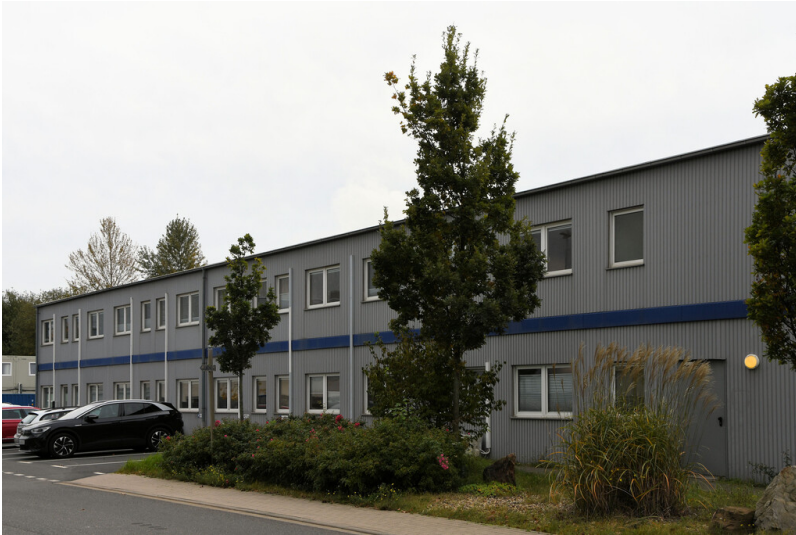
Kraftwerk Neurath: Gebäude der Bauleitung, nördlicher Seitenflügel, Ansicht von Nordwesten; Foto: 23.10.2023