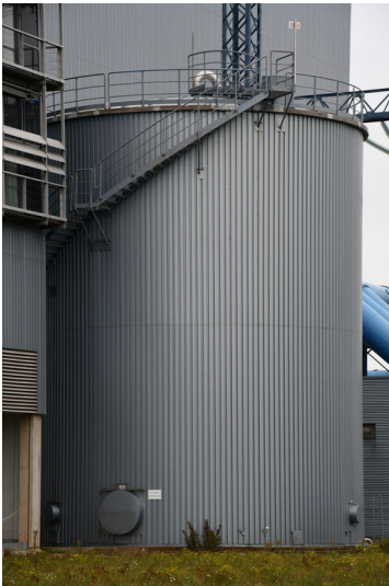
Kraftwerk Neurath: Kalkkondensatspeicher für Block G, Ansicht von Westen