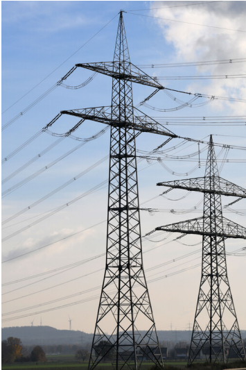
Kraftwerk Neurath: Hochspannungsleitung Blöcke F/G - Umspannanlage Rommerskirchen, Anschluss an Abspannmast 12 (Leitung Bl.-Nr. 4517) (linker Mast), rechts Leitung Bl.-Nr. 4535, Ansicht von Norden; Foto: 22.11.2023