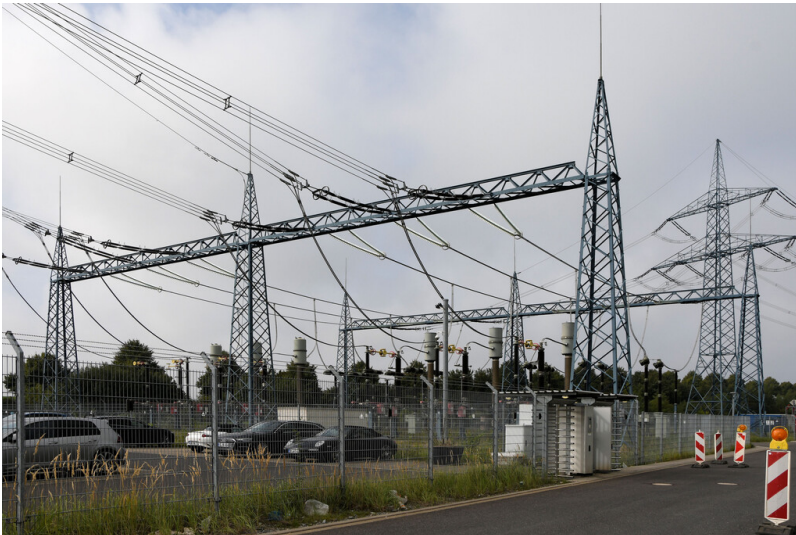
Kraftwerk Neurath: Freiluft-Schaltanlage Blöcke F/G, Abgang der Leitungsseile (Viererbündel) als 380-kV-Leitungen "Neurath 4d" und "Neurath 5e", Ansicht von Nordosten