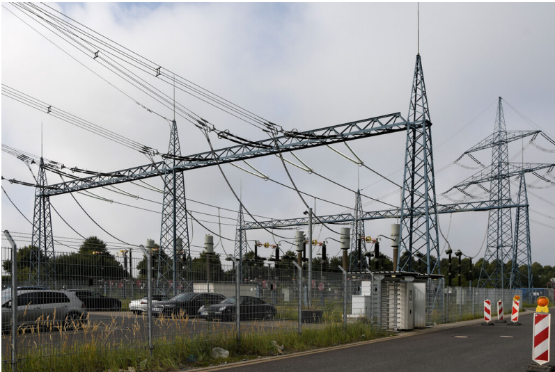
Kraftwerk Neurath: Freiluft-Schaltanlage Blöcke F/G, Abgang der Leitungsseile (Viererbündel) als 380-kV-Leitungen "Neurath 4d" und "Neurath 5e", Ansicht von Nordosten