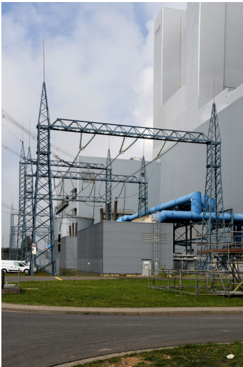
Kraftwerk Neurath: Maschinentransformatoren von Block G, Ansicht von Südosten; Foto: 14.09.2023