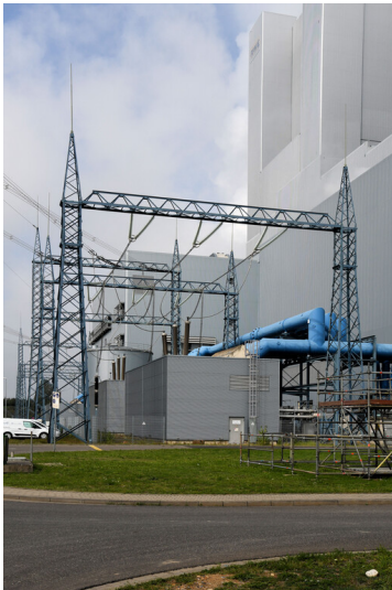
Kraftwerk Neurath: Maschinentransformatoren von Block G, Ansicht von Südosten; Foto: 14.09.2023