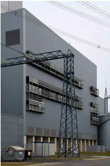
Kraftwerk Neurath (Neuanlage): Hauptschaltanlage, Ansicht von Südwesten; Foto: 23.10.2023