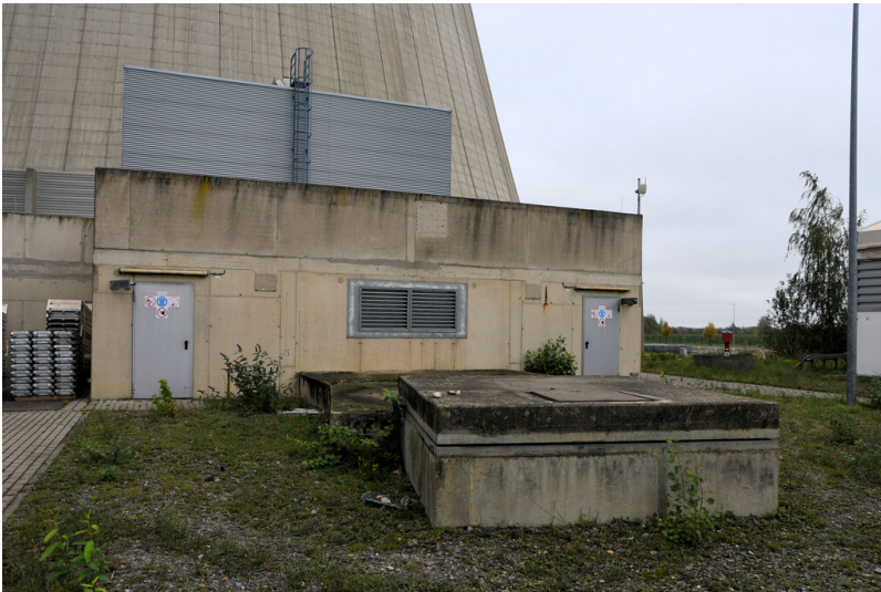
Kraftwerk Neurath (Neuanlage): Kühlwasser-Pumpenhaus Block G, Ansicht von Süden; Foto: 23.10.2023