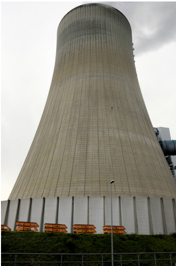
Kraftwerk Neurath (Neuanlage): Naturzug-Kühlturm Block G, Schallschutzwand an der Kühlturmbasis, Ansicht von Westen; Foto: 23.10.2023