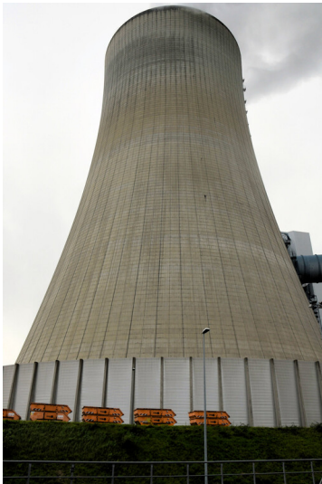
Kraftwerk Neurath (Neuanlage): Naturzug-Kühlturm Block G, Schallschutzwand an der Kühlturmbasis, Ansicht von Westen; Foto: 23.10.2023