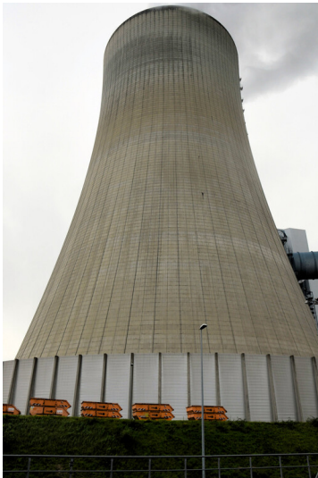
Kraftwerk Neurath (Neuanlage): Naturzug-Kühlturm Block G, Schallschutzwand an der Kühlturbasis, Ansicht von Westen; Foto: 23.10.2023