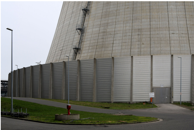
Kraftwerk Neurath (Neuanlage): Naturzug-Kühlturm Block F, Schallschutzwand, Ansicht von Nordosten