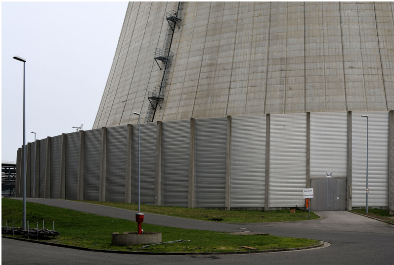
Kraftwerk Neurath (Neuanlage): Naturzug-Kühlturm Block F, Schallschutzwand, Ansicht von Nordosten; Foto: 23.10.2023