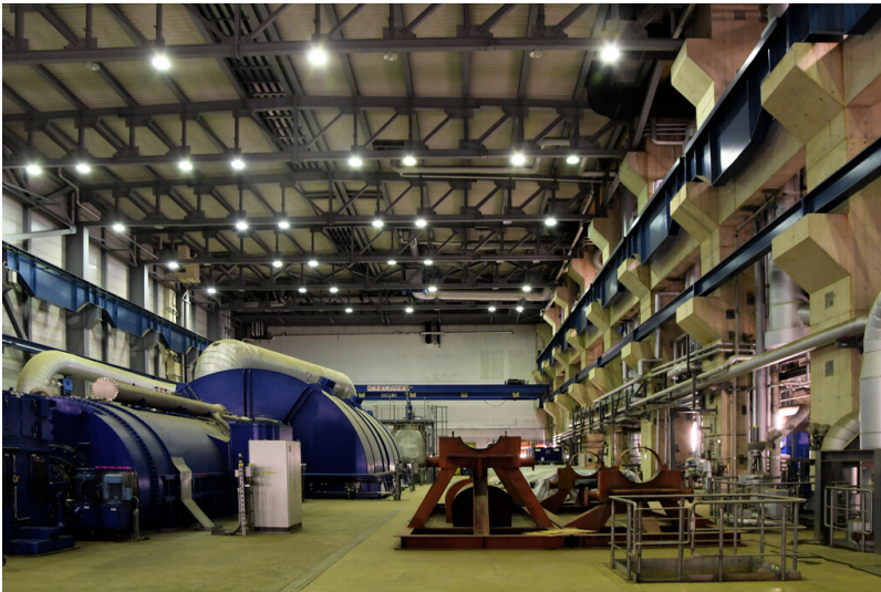
Kraftwerk Neurath: Maschinenhaus Block G, Innenansicht von Osten; Foto: 23.10.2023