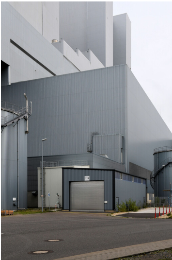
Kraftwerk Neurath: Maschinenhaus Block F, Ansicht von Südwesten; Foto: 23.10.2023