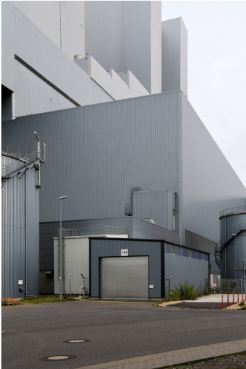
Kraftwerk Neurath: Maschinenhaus Block F, Ansicht von Südwesten; Foto: 23.10.2023