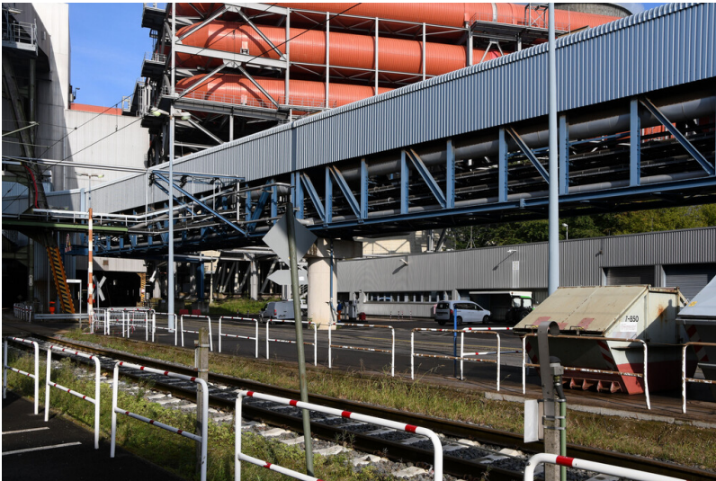
Kraftwerk Neurath: Entschungsweg Ascheverladeturm 1 - Ascheverladung F/G, Ansicht von Südosten; Foto: 12.09.2023