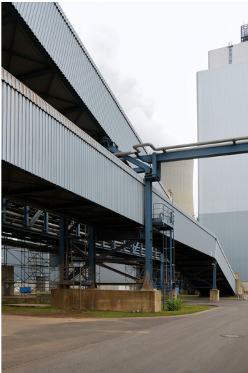
Kraftwerk Neurath (Neuanlage): Entschungsweg Blöcke F/G - Ascheverladeturm 1, Ansicht von Westen; Foto: 23.10.2023