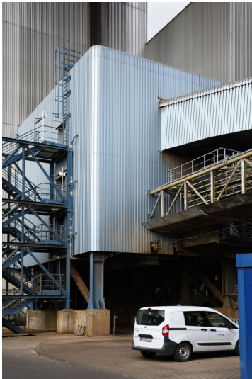
Kraftwerk Neurath: Ascheverladung F/G, Ansicht von Südosten; Foto: 12.09.2023