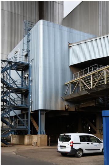
Kraftwerk Neurath: Ascheverladung F/G, Ansicht von Südosten; Foto: 12.09.2023