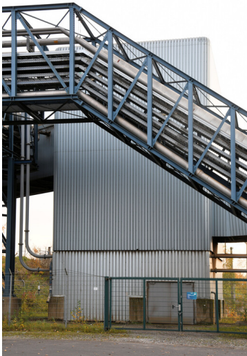
Kraftwerk Neurath (Neuanlage): Ascheverladeturm 2, Ansicht von Norden