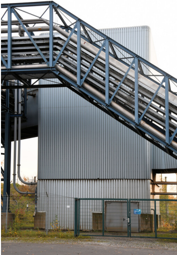
Kraftwerk Neurath (Neuanlage): Ascheverladeturm 2, Ansicht von Norden; Foto: 22.11.2023