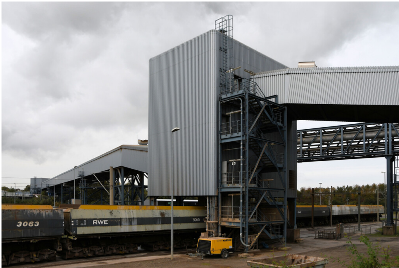
Kraftwerk Neurath (Neuanlage): Ascheverladeturm 1, Ansicht von Süden; Foto: 23.10.2023