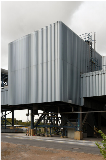
Kraftwerk Neurath (Neuanlage): Gipsverladeturm, Ansicht von Südosten; Foto: 23.10.2023