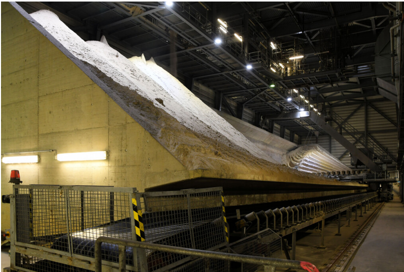
Kraftwerk Neurath (Neuanlage): Gipslager, Bunkertaschen, Gipsabzugsband und Gipsbagger, Innenansicht; Foto: 23.10.2023