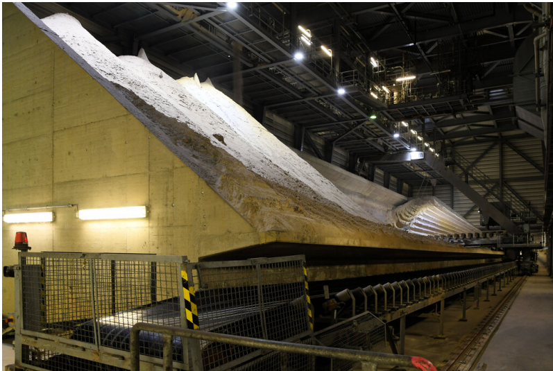
Kraftwerk Neurath (Neuanlage): Gipslager, Bunkertaschen, Gipsabzugsband und Gipsbagger, Innenansicht; Foto: 23.10.2023