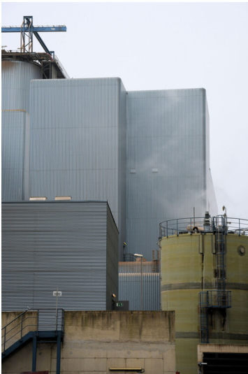
Kraftwerk Neurath (Neuanlage): Gipsentwässerung, Auffangbehälter, Gipsentwässerungsgebäude und Gipslager (im Hintergrund), Ansicht von Osten