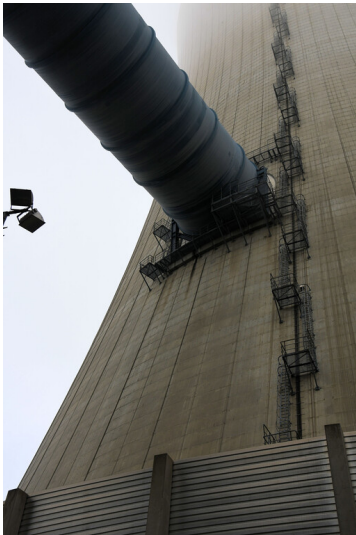
Kraftwerk Neurath (Neuanlage): Reingaseinleitung in den Kühlturm G, Ansicht von Westen; Foto: 23.10.2023