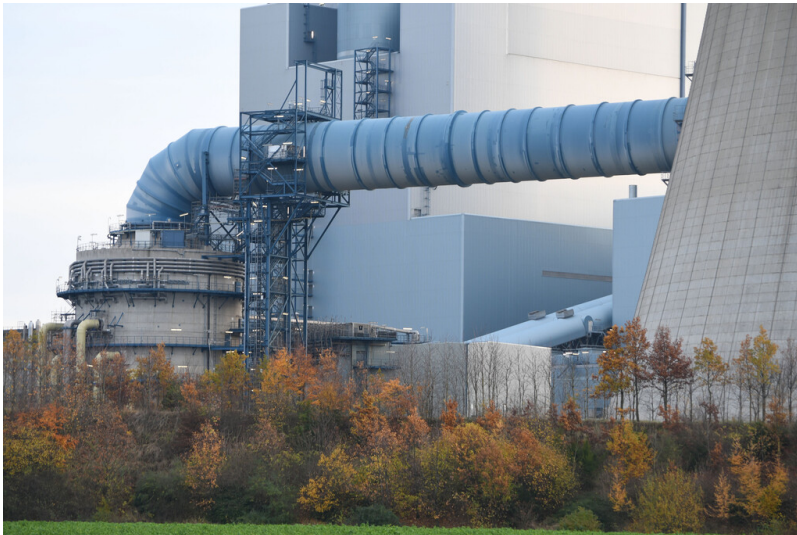
Kraftwerk Neurath (Neuanlage): Reingaseinleitung in den Kühlturm F, Ansicht von Nordwesten; Foto: 22.11.2023