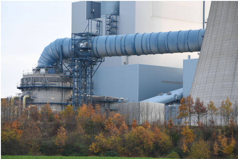
Kraftwerk Neurath (Neuanlage): Reingaseinleitung in den Kühlturm F, Ansicht von Nordwesten; Foto: 22.11.2023