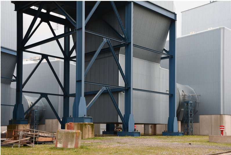
Kraftwerk Neurath (Neuanlage): Rauchgaskanal, Ausgang von Saugzug F1, Ansicht von Nordwesten; Foto: 23.10.2023