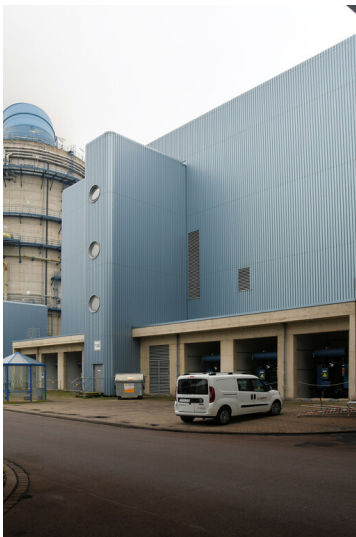
Kraftwerk Neurath (Neuanlage): REA-Schaltanlagegebäude, Ansicht von Nordwesten; Foto: 23.10.2023