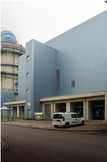
Kraftwerk Neurath (Neuanlage): REA-Schaltanlagegebäude, Ansicht von Nordwesten