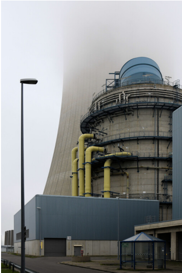
Kraftwerk Neurath (Neuanlage): Absorber Block G, Ansicht von Nordwesten; Foto: 23.10.2023