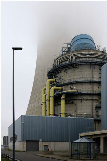
Kraftwerk Neurath (Neuanlage): Absorber Block G, Ansicht von Nordwesten; Foto: 23.10.2023