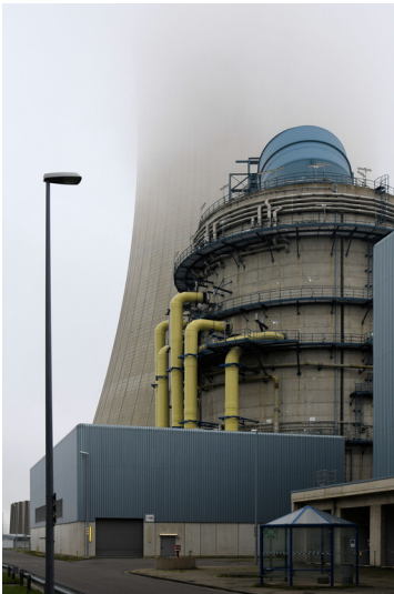
Kraftwerk Neurath (Neuanlage): Absorber Block G, Ansicht von Nordwesten; Foto: 23.10.2023