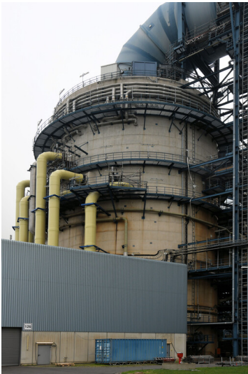
Kraftwerk Neurath (Neuanlage): Absorber Block F, Ansicht von Westen; Foto: 23.10.2023