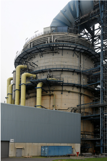
Kraftwerk Neurath (Neuanlage): Absorber Block F, Ansicht von Westen; Foto: 23.10.2023