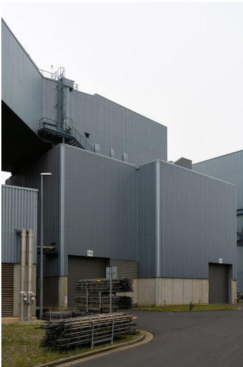
Kraftwerk Neurath (Neuanlage): Saugzuggebäude G2, Ansicht von Südosten; Foto: 23.10.2023