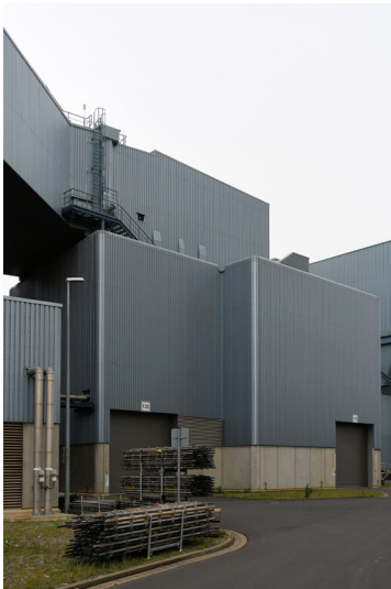
Kraftwerk Neurath (Neuanlage): Saugzuggebäude G2, Ansicht von Südosten; Foto: 23.10.2023