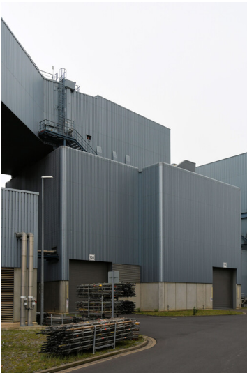
Kraftwerk Neurath (Neuanlage): Saugzuggebäude G2, Ansicht von Südosten; Foto: 23.10.2023