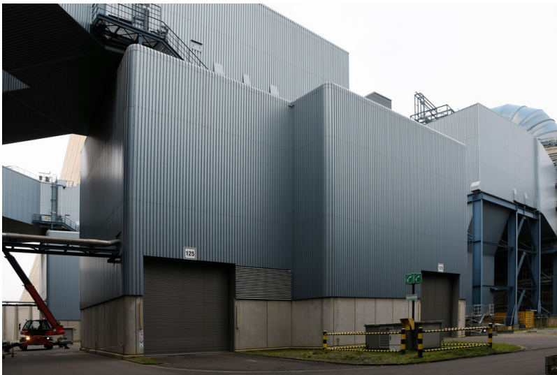
Kraftwerk Neurath (Neuanlage): Saugzuggebäude F2, Ansicht von Südosten