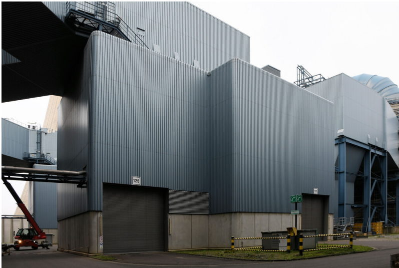
Kraftwerk Neurath (Neuanlage): Saugzuggebäude F2, Ansicht von Südosten; Foto: 23.10.2023