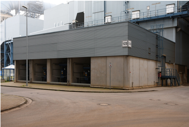
Kraftwerk Neurath (Neuanlage): Schaltanlagegebäude E-Filter Block G, Ansicht von Südwesten; Foto: 23.10.2023