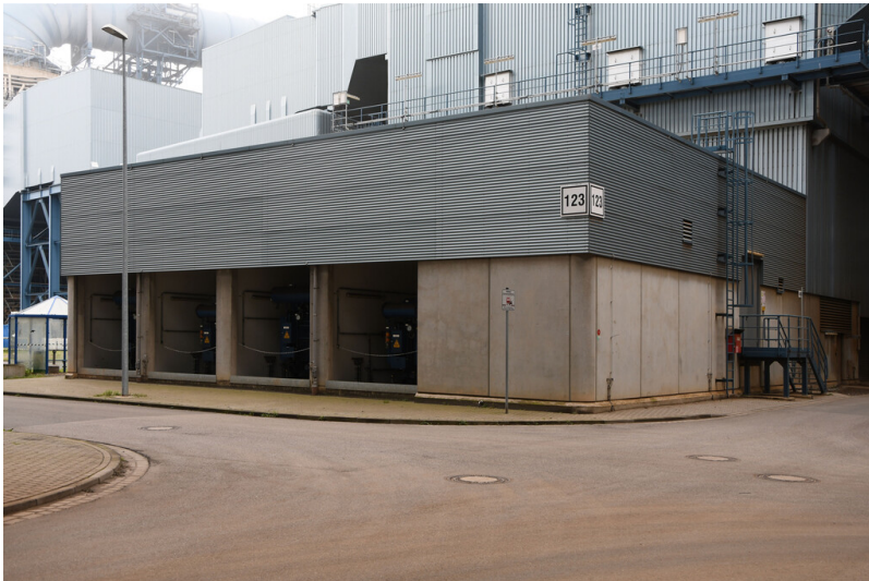
Kraftwerk Neurath (Neuanlage): Schaltanlagegebäude E-Filter Block G, Ansicht von Südwesten; Foto: 23.10.2023