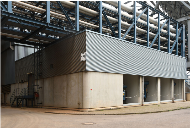
Kraftwerk Neurath (Neuanlage): Schaltanlagegebäude E-Filter Block F, Ansicht von Südosten