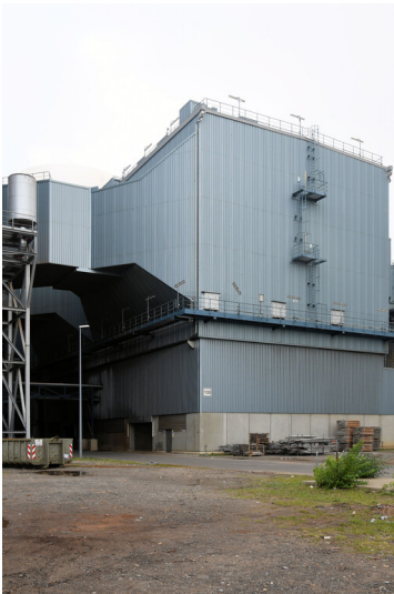
Kraftwerk Neurath (Neuanlage): Elektrofilter Block G, Ansicht von Südosten; Foto: 23.10.2023