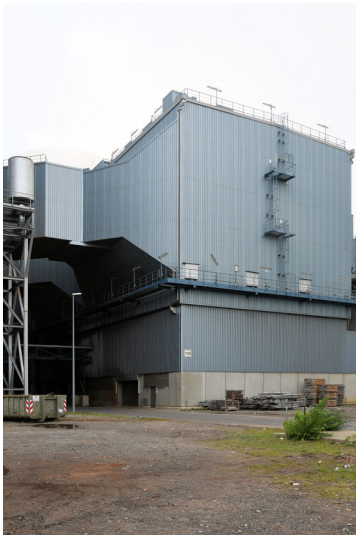
Kraftwerk Neurath (Neuanlage): Elektrofilter Block G, Ansicht von Südosten; Foto: 23.10.2023