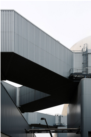
Kraftwerk Neurath (Neuanlage): Elektrofilter Block F, Rauchgaskanäle zu den Saugzügen, Ansicht von Osten