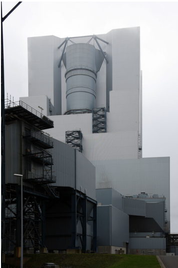
Kraftwerk Neurath (Neuanlage): Kesselhaus Block F, Rauchgasleerzug, Ansicht von Norden; Foto: 23.10.2023