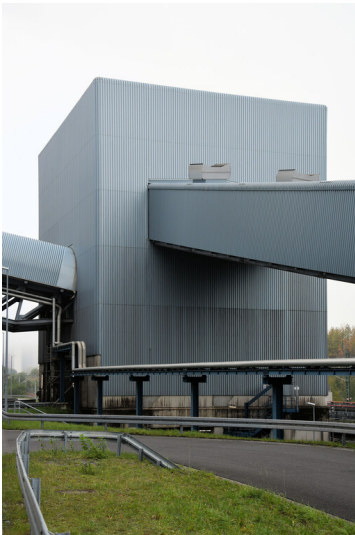
Kraftwerk Neurath (Neuanlage): Eisenaushaltung (Eisenausscheidung), Ansicht von Südosten